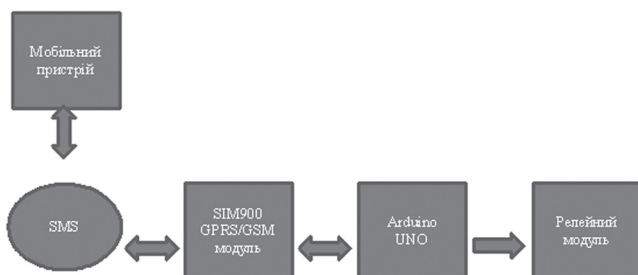
Рис. 1. Блок-схема прототипа управління електроприладами за допомогою модуля GSM і Arduino

SIM900 GPRS/GSM модуль буде з'єднано Rx/Tx виходами на Arduino. SIM900 GPRS/GSM модуль буде використано з метою приймання і передавання текстових повідомлень для мобільного пристрою. Релейний модуль RM540C буде також приєднано до входів/виходів Arduino. Релейний модуль отримуватиме команди від Arduino для перемикання реле.