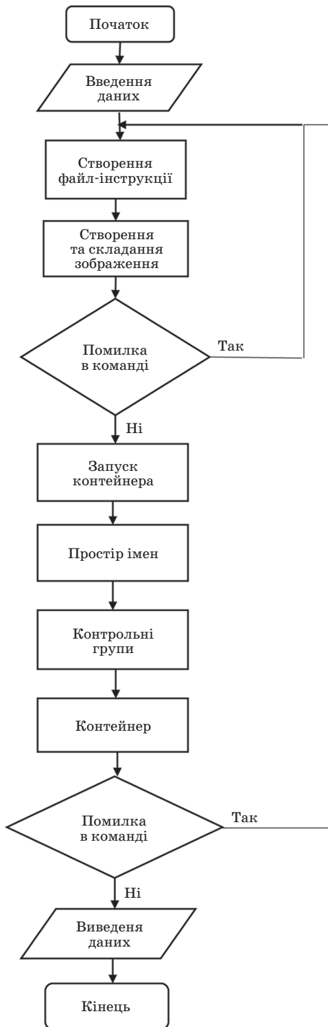
Рис. 1. Етапи створення додатків

зображення. Зображення в сервісно-об'єктному проектуванні буде створено автоматично, після прочитання програмним забезпеченням інструкцій [1; 2].